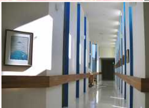
風の廊下を逆から観ると…

竜爪園ユザト棟の「風の廊下」に朝の光がそそぎます。 この廊下を、毎日たくさんの人々が通ります。 「おはようございます」 「おはようございます」 「お早いですね」 今日も一日が始まります。今日はすばらしい秋晴れです。