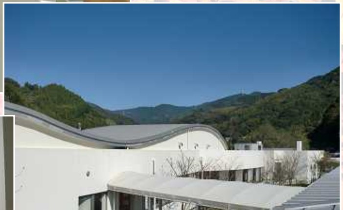
竜爪園から平山を望む

竜爪園ユザト棟の「風の廊下」に朝の光がそそぎます。 この廊下を、毎日たくさんの人々が通ります。 「おはようございます」 「おはようございます」 「お早いですね」 今日も一日が始まります。今日はすばらしい秋晴れです。